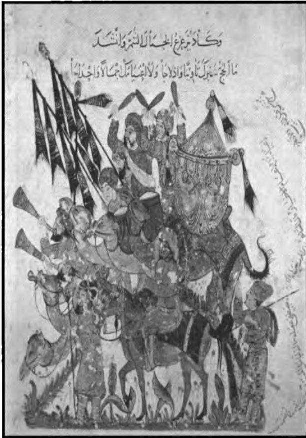
هارون الرشيد بين فرسانه